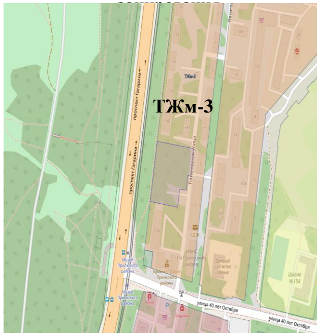
Фрагмент карты территориального